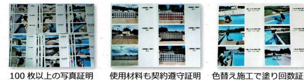
100枚以上の写真証明

契約遵守“証明”も明確に【100枚以上の写真付き作業証明報告書】を作成提出致します