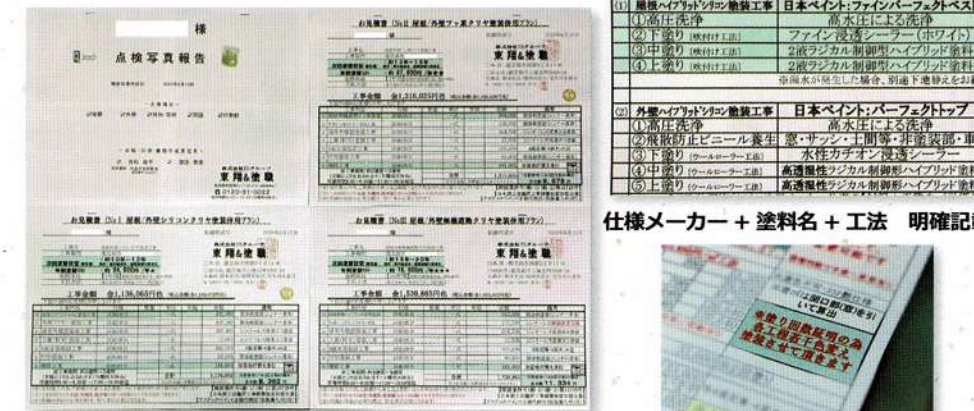
点検報告写真+見積複数プラン 無料作成

“何の塗料”を“どのように塗る”も明確に【見積書は塗料名+工法+塗り回数等詳細まで記載】