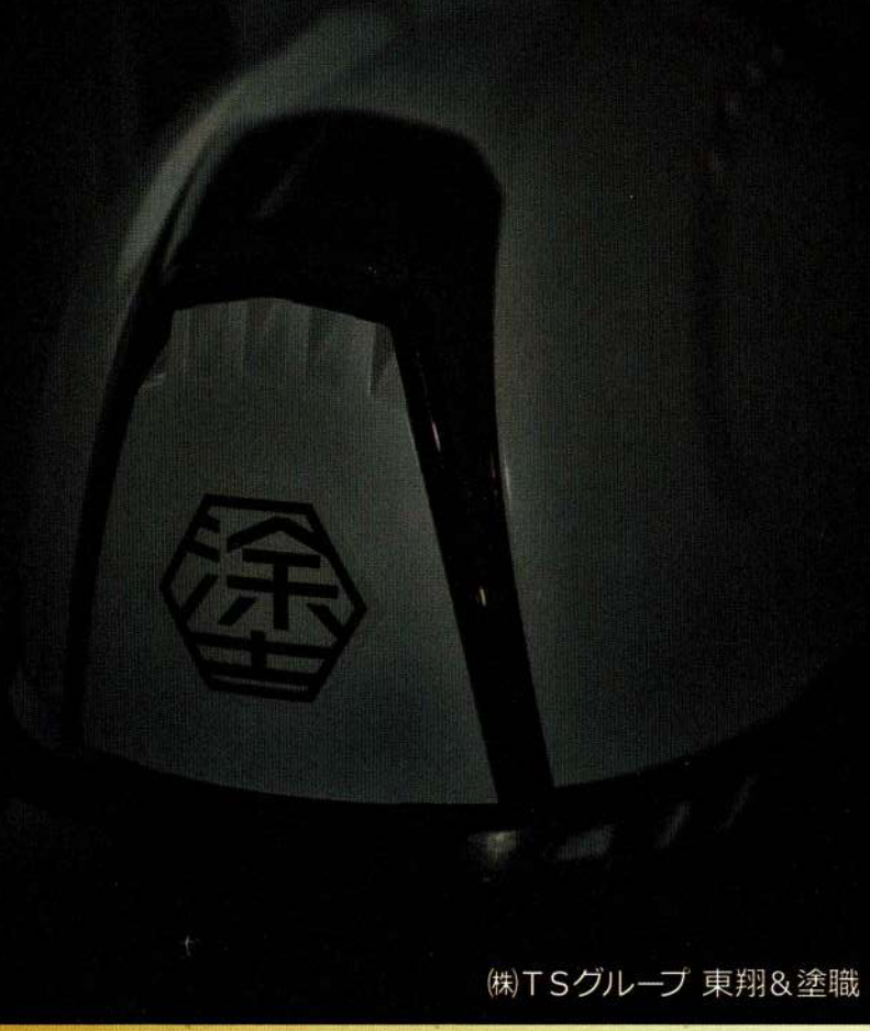
(株)TSグループ 東翔&塗職